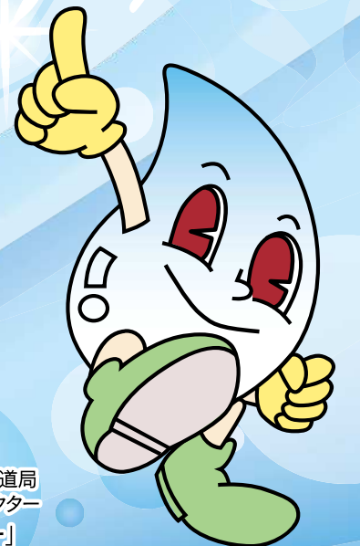
北九州市上下水道局 マスコットキャラクター 「スイッピー」