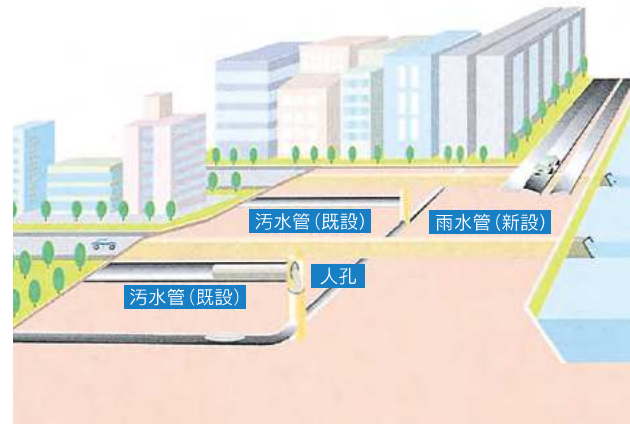
今まで一つの下水管で処理していた雨水と汚水を、雨水管を新設してふたつに分けて処理することによって、公共水域に汚水が流出する心配がなくなる。

河川再生事業を進めている八幡西区の撥川流域において、平成9年度より河川事業と連携しながら、分流化が進められている。現在は、板櫃川や槻田川流域においても一部の合流地区の分流化を進めている。