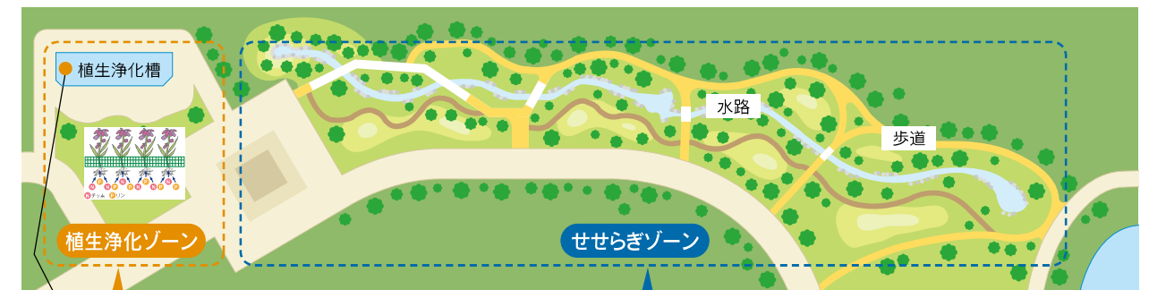
植生浄化槽(長さ 30m、幅 8m)

下水処理水を環境用水として再利用・活用することは本市にとっては初めての事例であり、全国的にも植物生態系による下水処理水の浄化施設は多くない。