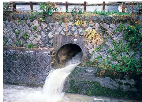
雨天時の合流式下水道の雨水吐の様子(板櫃川)

老朽化や市街化の進展に伴う雨水流出量の増大などにより、ポンプ場の改築・更新や増強が必要である。八幡西区の藤田ポンプ場は、JR黒崎駅周辺に降った雨水を排水するため昭和38年に運転を開始していたが、近年、大雨による浸水被害がたびたび発生したことから、早期に雨水ポンプを増強することが求められていた。さらに、施設の老朽化が進んでいたため、雨水ポンプの更新に併せて、浸水被害の解消と合流式下水道の改善を同時に達成することを目的に、隣接した城山緑地内に新たに雨水ポンプ場を建設し、平成24年度に供用を開始した。