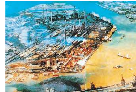
昭和30年代の洞海湾

当時の洞海湾は、本市の公害問題のすべてが映し出された、悪い意味での北九州市のシンボルの存在であった。今ではたくさんの生物が棲む海によみがえった。