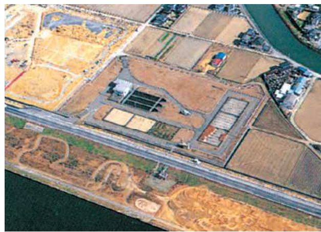
猪熊取水場 (昭和58年完成)

※ 第一次、第二次、第三次工業用水道と産炭地域工業用水道を北九州市工業用水道事業として事業統合した。(平成20年4月1日)