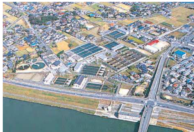
伊佐座取水場 (昭和19年完成)