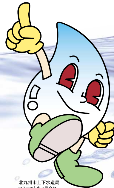
北九州市上下水道局 マスコットキャラクター 「スイッピー」