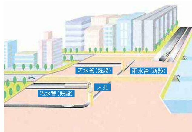
今まで一つの下水管で処理していた雨水と汚水を、雨水管を新設してふたつに分けて処理することによって、公共水域に汚水が流出する心配がなくなる。

河川再生事業を進めている八幡西区の櫛川流域において、平成9年度より河川事業と連携しながら、分流化が進められている。現在は、板櫃川や紫川流域においても一部の合流地区の分流化を進めている。