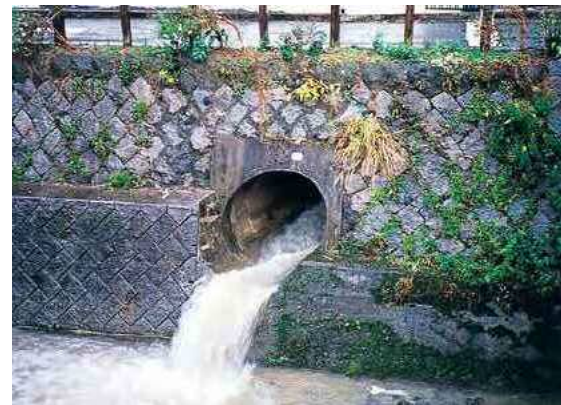
雨天時の合流式下水道の雨水吐の様子(板櫃川)

老朽化や市街化の進展に伴う雨水流出量の増大などにより、ポンプ場の改築・更新や増強が必要である。八幡西区の藤田ポンプ場は、JR黒崎駅周辺に降った雨水を排水するため昭和38年に運転を開始していたが、近年、大雨による浸水被害がたびたび発生したことから、早期に雨水ポンプを増強することが求められていた。さらに、施設の老朽化が進んでいたため、雨水ポンプの更新に併せて、浸水被害の解消と合流式下水道の改善を同時に達成することを目的に、隣接した城山緑地内に新たに雨水ポンプ場を建設し、平成24年度に供用を開始した。