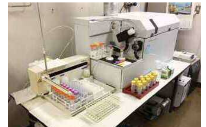
重金属測定用分析機器(ICP-MS)

また、平成4年にトリハロメタン等が加わった水質基準の改正が行われたが、その後クリプトスポリジウム等の耐塩素性病原微生物や環境ホルモン、ハロ酢酸等の消毒副生成物など新たな問題が発生したため、より厳しい水質管理を行う必要が生じ、平成16年4月に水質基準の大幅な改正が行われた。