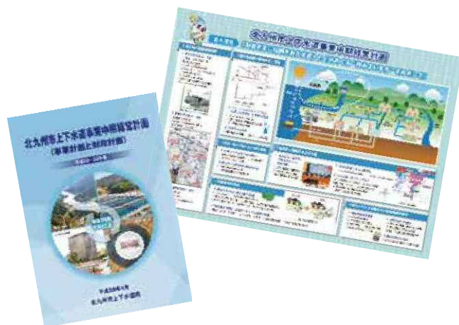
北九州市上下水道事業中期経営計画

今後は、平成24年度の上下水道局発足を受け、上下水道事業統合による効果を活かしながら、より一層、安全・安心で誰からも信頼される上下水道を目指していく。