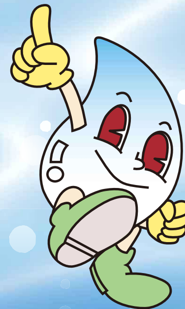
北九州市上下水道局 マスコットキャラクター 「スイッピー」